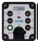
Kontrola míry zhutnění COMPATROL® 2.0