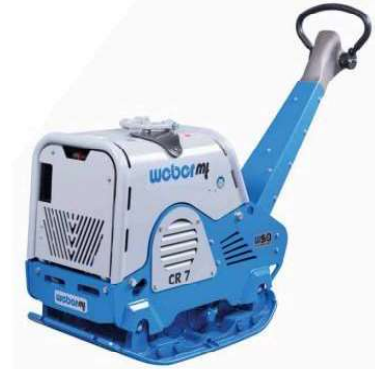
CR 7 Hd