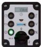
MDM ochrana motoru