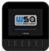
Weber Smart Assist